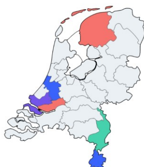
Figuur 1: Regionale ophoging door 6 GGD'en

Gemeentes dragen een verantwoordelijkheid voor de seksuele gezondheid van hun inwoners door de Wet Publieke Gezondheid (Ministerie van Volksgezondheid, Welzijn en Sport, 2022). Op lokaal niveau is inzicht in de seksuele gezondheid van jongeren van belang om beleid en interventies aan te laten sluiten op de lokale situatie. Net als bij Seks onder je 25 e 2017 kregen alle GGD'en de mogelijkheid om binnen de regio extra